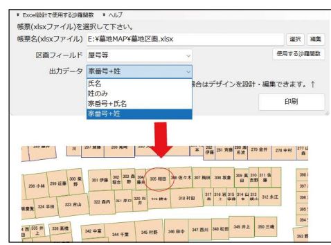
エクセルで作成した区画図上に、檀家様リストの氏名などを表示・印刷することができます

シンサラでは、墓地や納骨堂・位牌堂・駐車場・貸地などの エクセルで作れる区画図 に、 今現在の戸主名や担当墓石屋さんなど指定した項目を出力 することをご希望できるようにしました。応用が広がります。